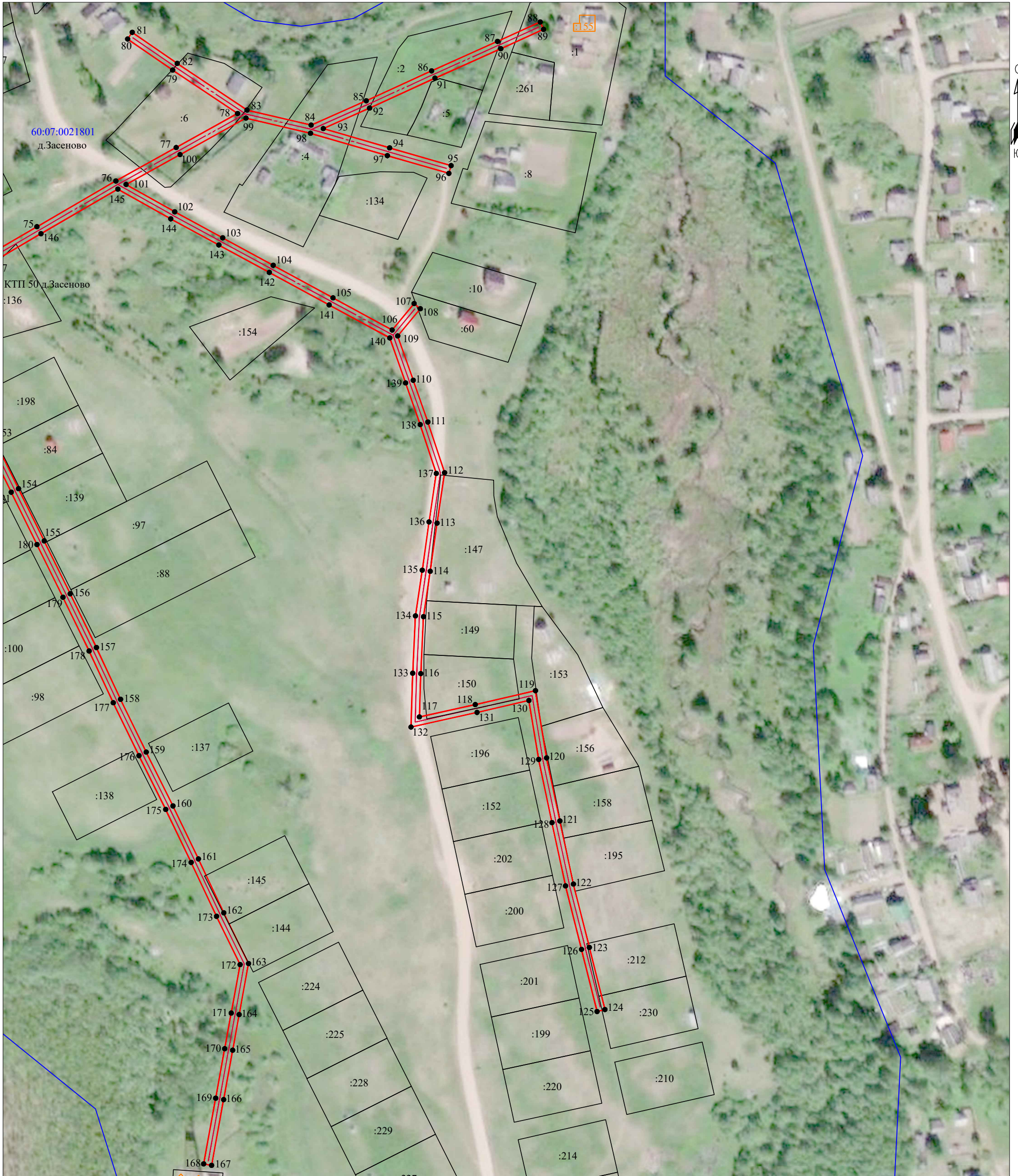
Схема расположения границ публичного сервитута "ВЛ 0.4 кВ от КТП 50 д.Засеново"