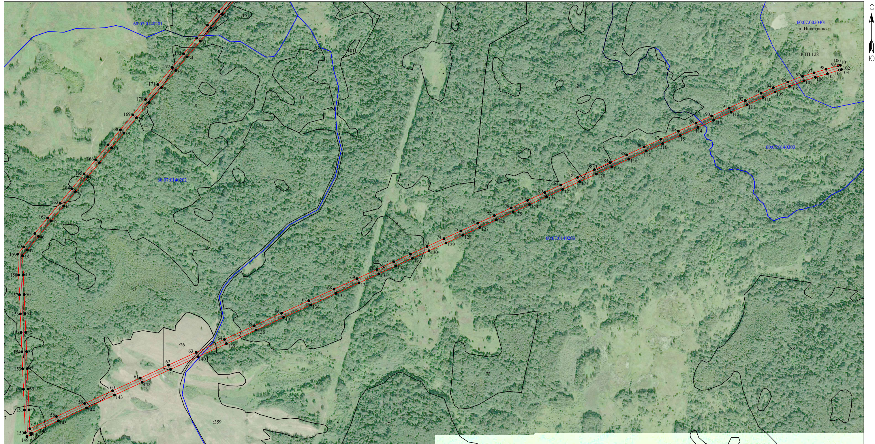
Схема расположения границ публичного сервитута "ВЛ-10 кВ ф 54-04 Назимово"